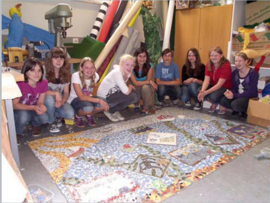
JkG Mosaik AG 2007-2011